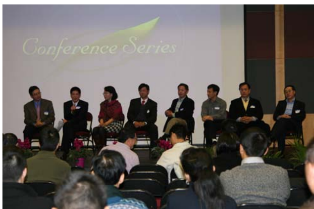
Panel discussions engaged the audience