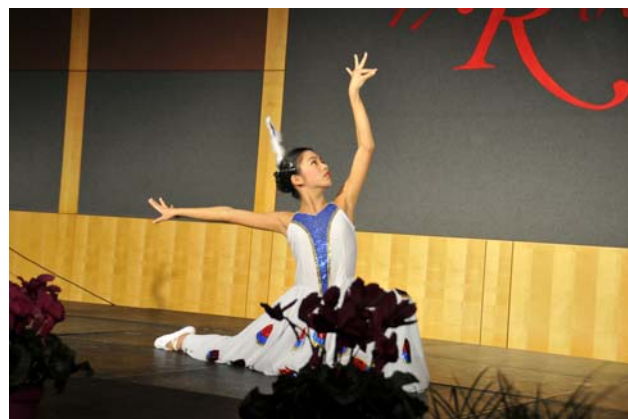
Lively performances at the New Year Party