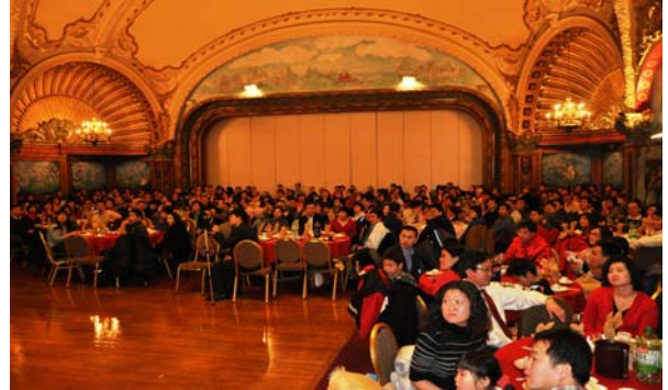
(来宾们在迎春晚会现场欢聚一堂)

现场观众捧腹大笑。将近 20 分钟的表演, 让晚会现场情绪高涨, 观众高呼过瘾。由于有着相似的留学移民经历, 许多观众在这些笑话中找到了“共鸣”的感觉, 阵阵笑声的背后, 也引发不少思考和人生感悟。